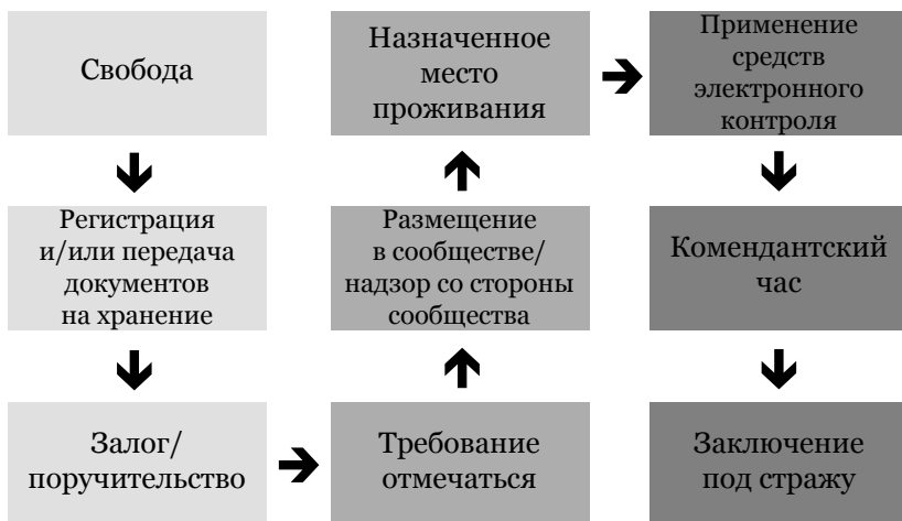
Рис. 2 66

41. Как показывает практика, альтернативы наиболее эффективны, когда лица, ищущие убежища: